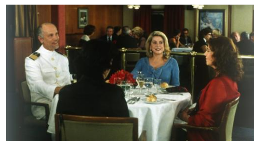
Avec Catherine Deneuve et John Malkovitch

Si ce dialogue parlé s'interrompt, la civilisation est en péril.